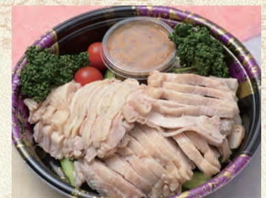
58 バンバンジー 2,160円