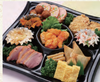
60 肴皿 3,780円