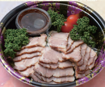
59 チャーシュー 2,700円