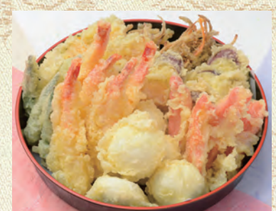
51 天ぷら 3,240円