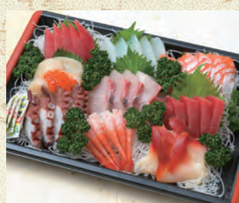
50 刺身 4,860円