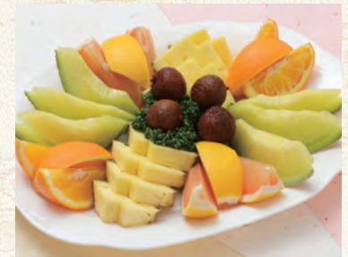
63 フルーツ皿 3,240円