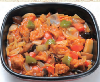
54 酢豚 3,240円