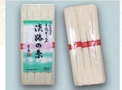
68 淡路島特産手延そうめん 648円 (無地箱 500g) (15名分)