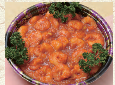
57 エビチリ 4,320円