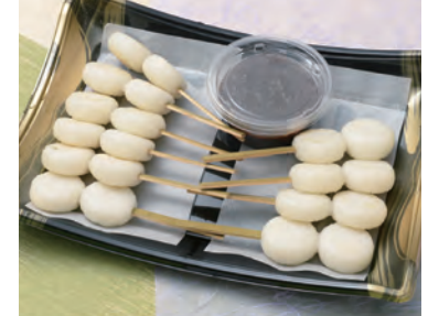
71 五平餅(10本入) 1,944円