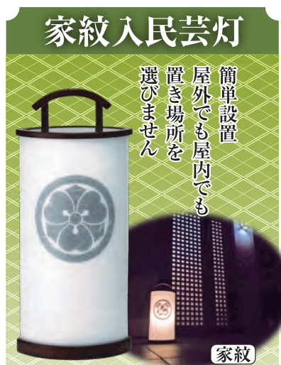
No.45 京こまち家紋入 高52cm 一般価格 23,000円 会員価格 18,400円