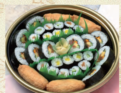
52 巻き寿司 1,944円