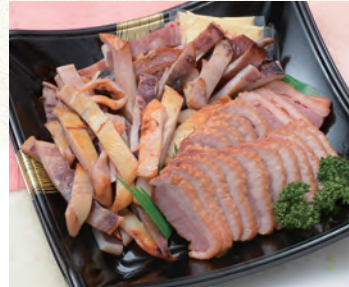
65 おつまみ皿 3,240円