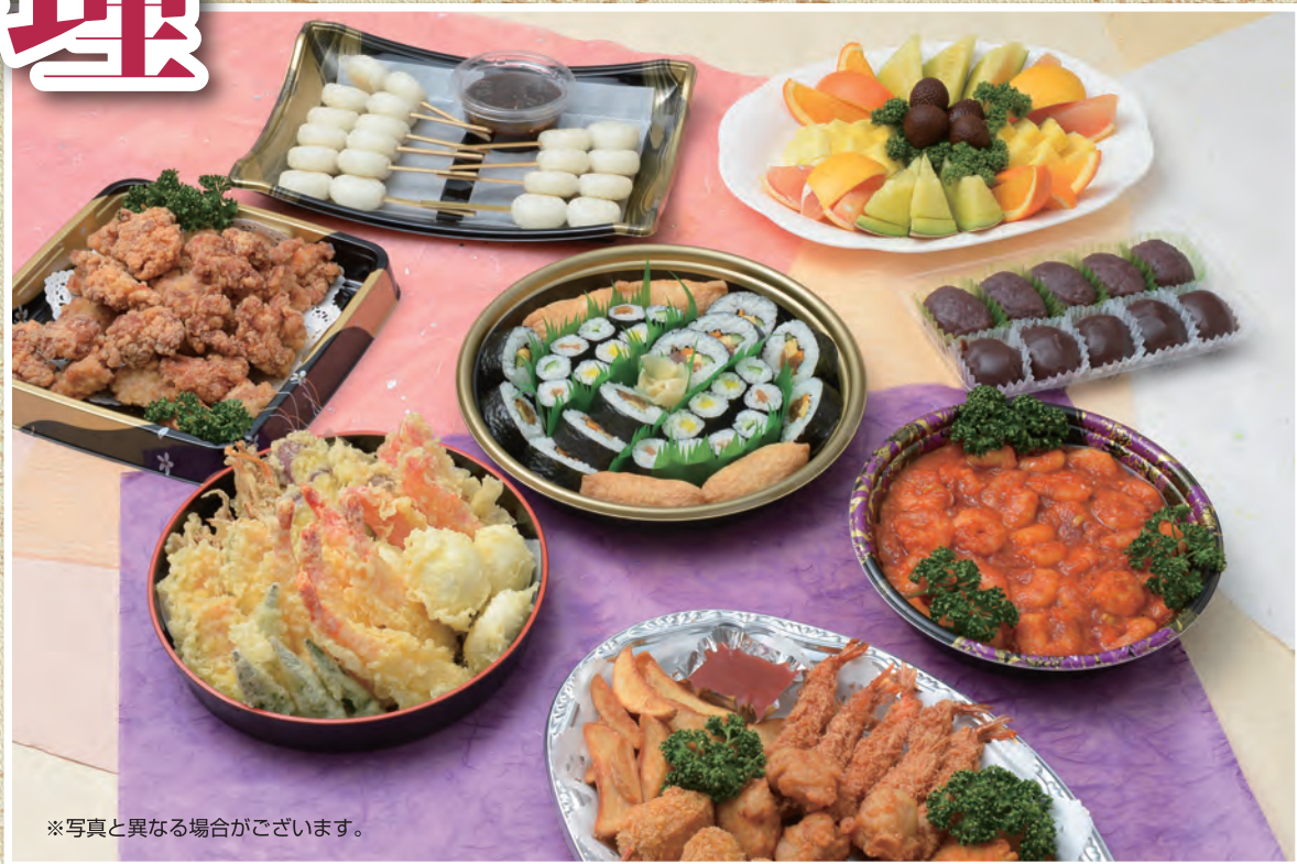
※写真と異なる場合がございます。