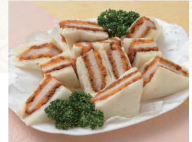
66 カツサンド 1,944円