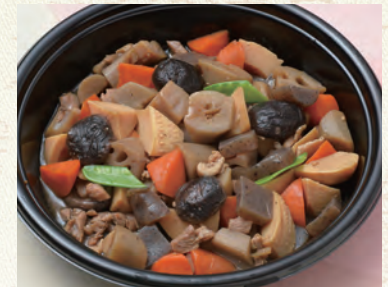
62 筑前煮 2,376円