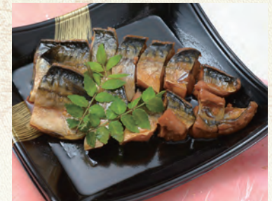
61 さば煮 2,160円