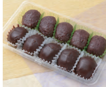
70 あんころ餅 1,512円