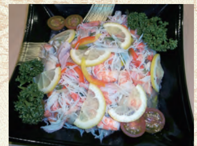
56 海鮮マリネ 3,780円