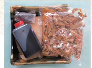
67 具つゆセット(20名分) 1,620円