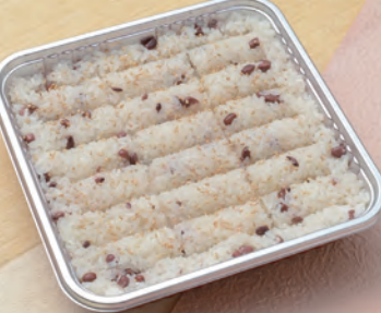
69 おこわ 1,620円