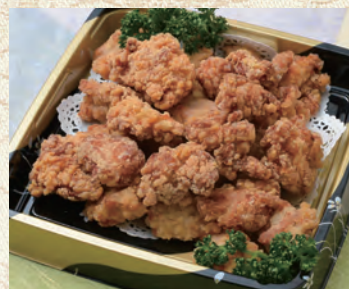
55 鶏の唐揚げ 3,240円