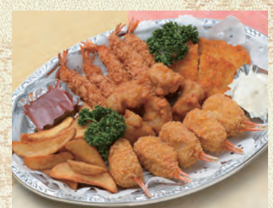
53 フライ皿 3,240円