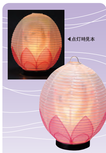
No.44 ペットらんたん 高19cm・幅16cm 印刷仕上げ ハス 画像データを専用の筒へ印刷します 一般価格 21,000円 会員価格 16,800円

※商品は多数用意しておりますが、 品切れの際はご容赦ください。 ※商品は、写真とは異なる場合がございます。 ※価格はすべて消費税 込みの価格です。