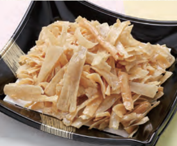
64 揚げごぼう 1,620円